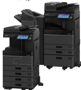
e-STUDIO2508A e-STUDIO3008A e-STUDIO3508A e-STUDIO4508A e-STUDIO5008A