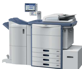
e-STUDIO5560c e-STUDIO6560c e-STUDIO6570c